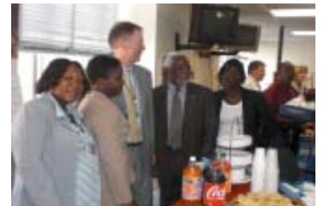
Direktè jeneral Vwadlamerik la ak anbasadè ayisyen an akonpaye kèk jounalis

Aprè bèl eksperyans sa jounalis yo te an mezi pou yo mete tout sa yo te pran an pratik.