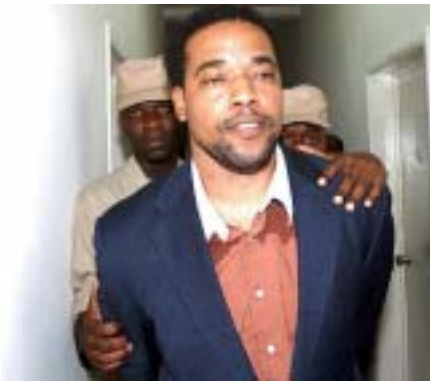
Mesak Damas nan men lapolis