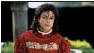
Maykèl Jaksòn (Michael Jackson (1958 - 2009))