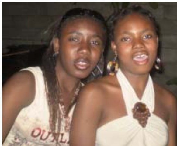
Pè Jan Out, Dirèk

Kòm 8 mas se jounen mondyal medam yo, Bon Nouvèl swete yo yon bòn fèt. Ansanm ak Djonpsonn Depre n ap fè yon bèl ochan pou yo.