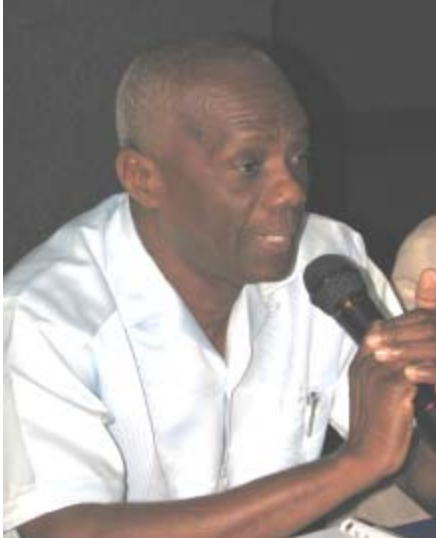
Minis Evans Leskouflè

Zirik (Zurich): yon lanmen rate, minis Leskouflè (Lescouflair) reyaji.